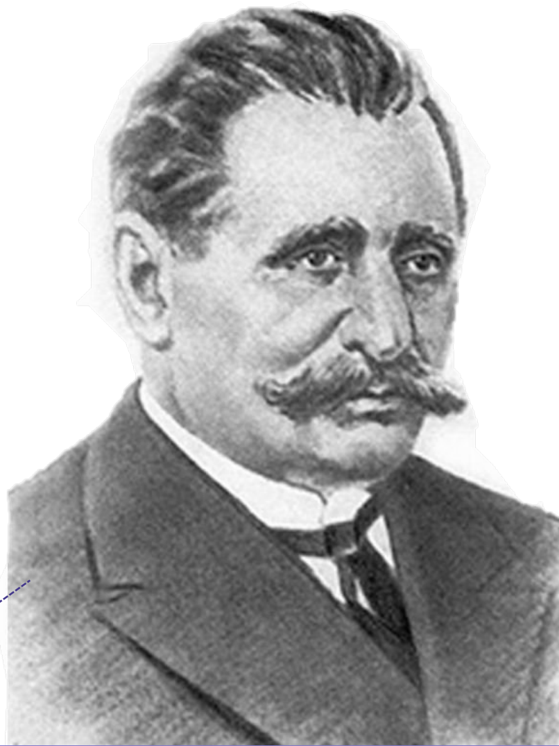
Александр Николаевич Лодыгин