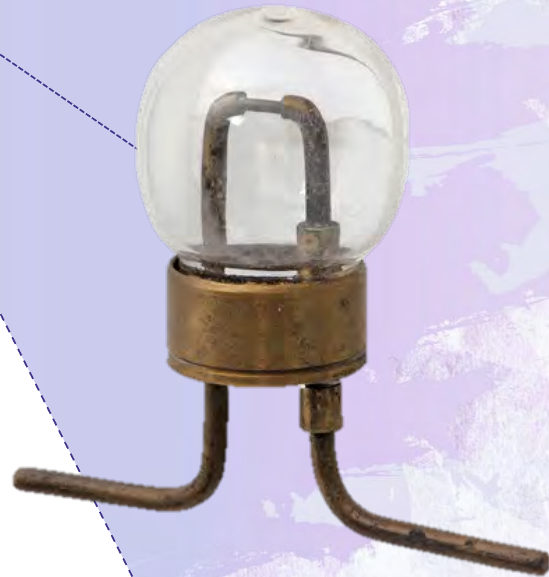
Лампа Лодыгина, 1874 г.