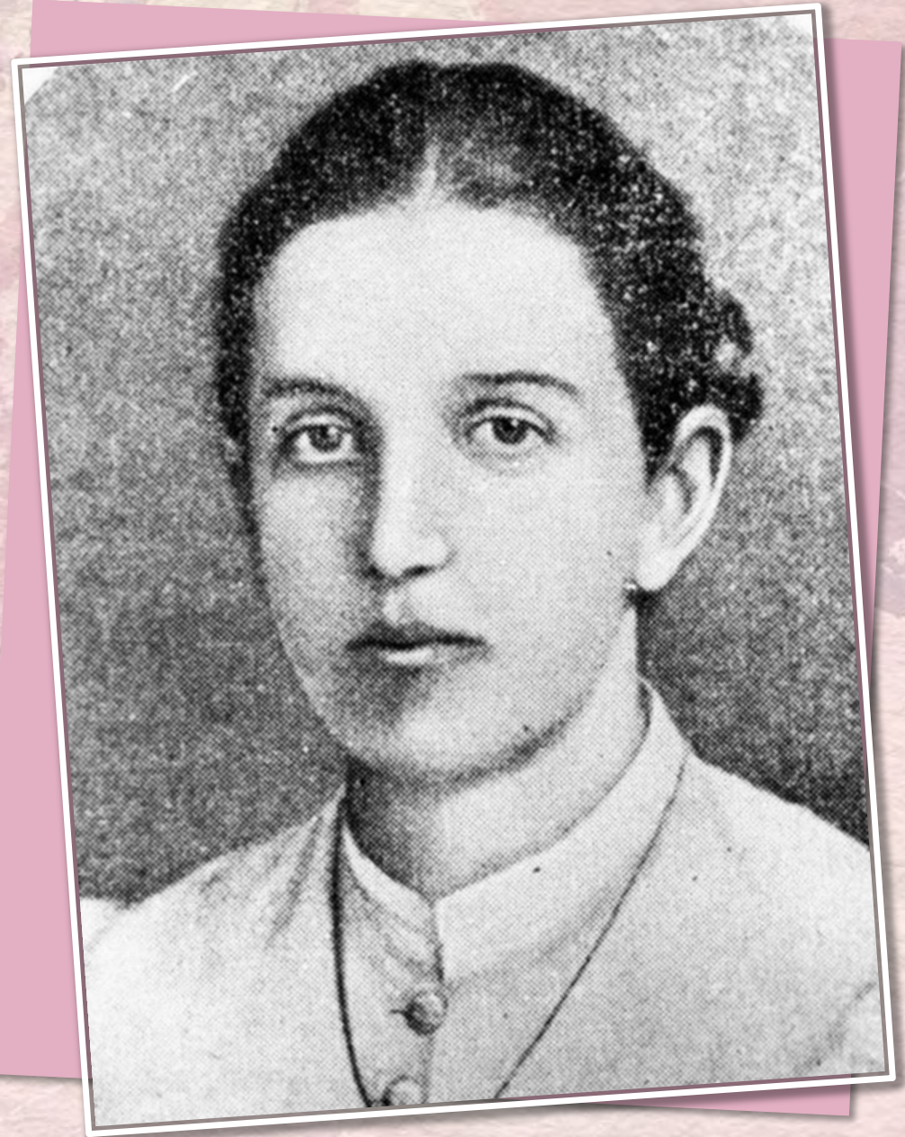
Фото, конец XIX в.

Российский ботаник, член-корреспондент Петербургской академии наук