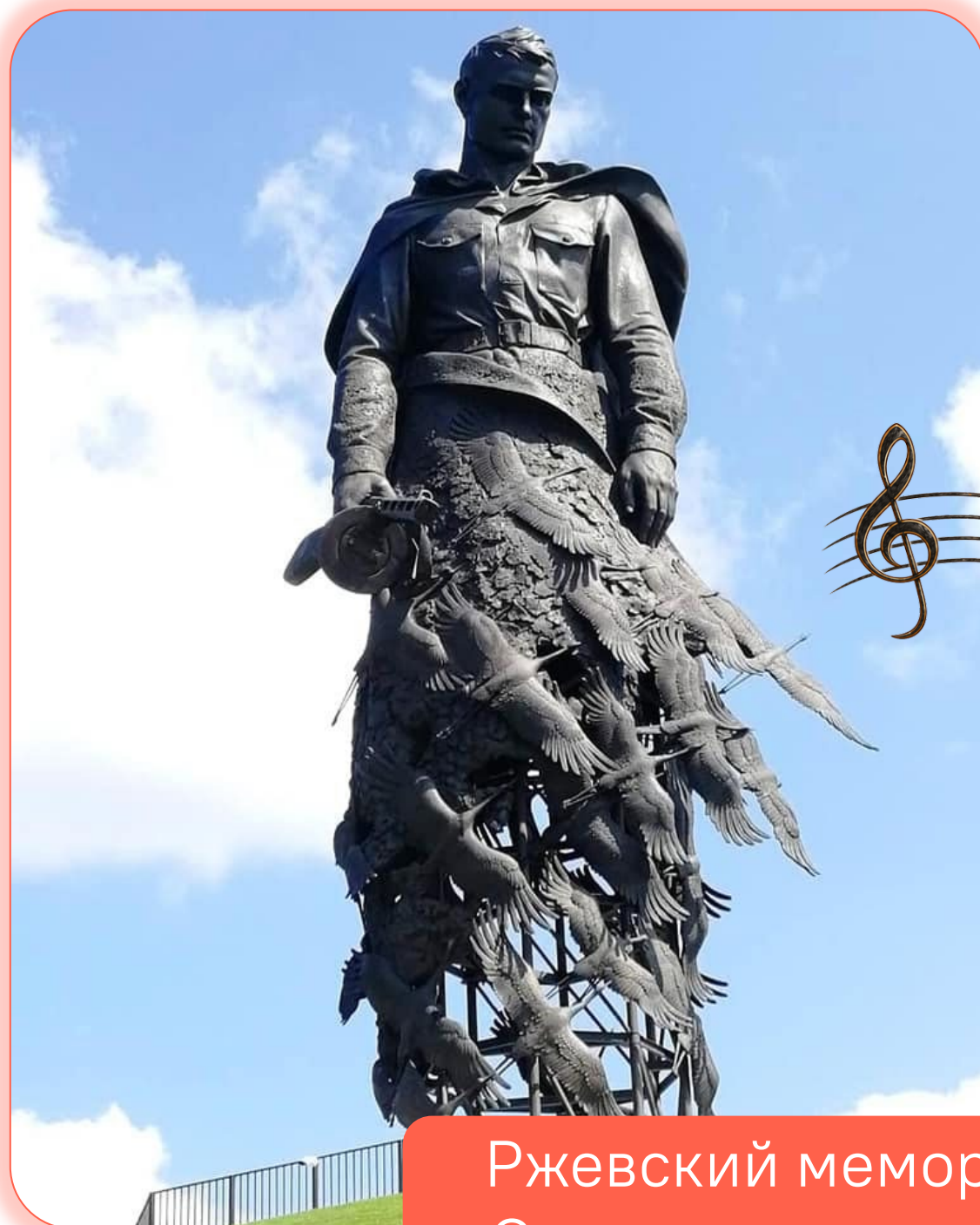
Ржевский мемориал Советскому солдату