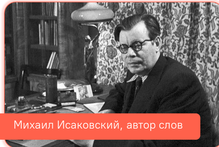
Михаил Исаковский, автор слов