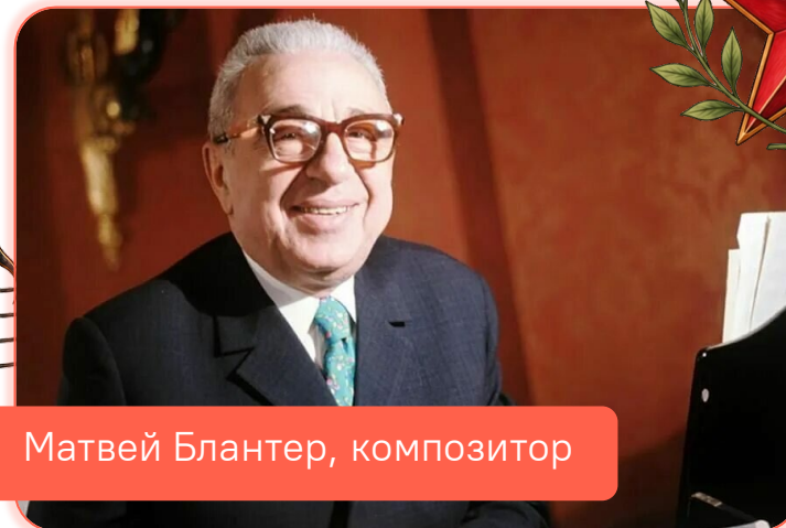
Матвей Блантер, композитор