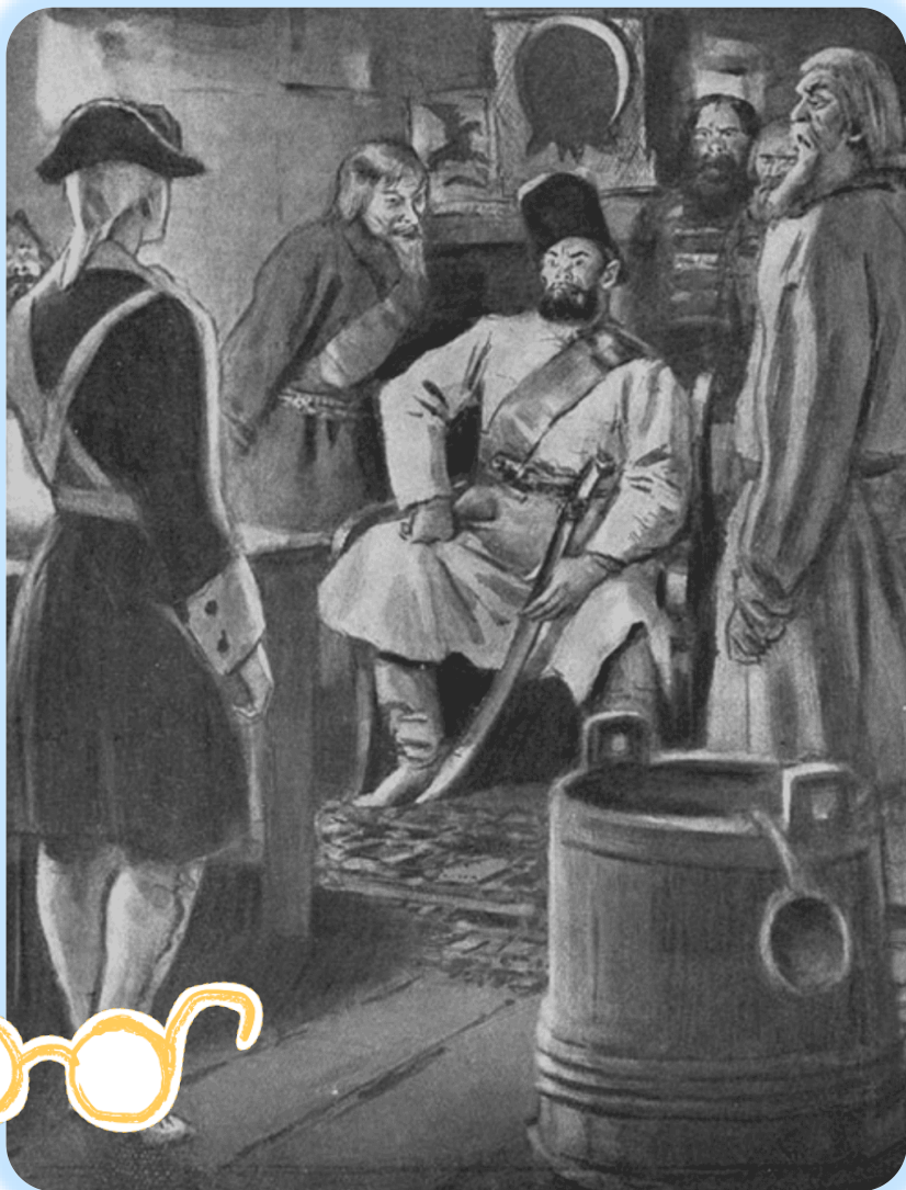
Иллюстрация к роману А. С. Пушкина «Капитанская дочка», худ. Герасимов С. В.