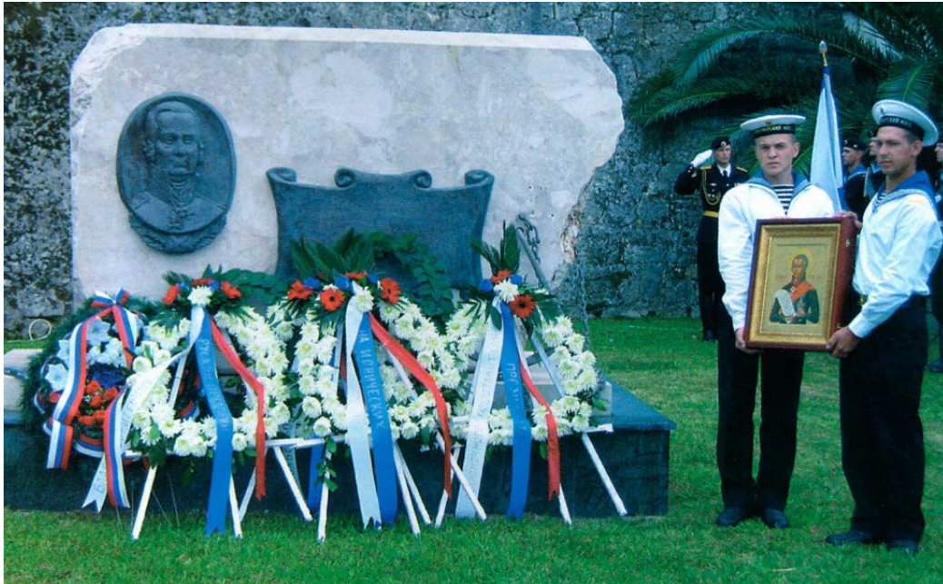
Памятник Ф. Ф. Ушакову на греческом острове Корфу

В 1797 году Франция захватила Ионические острова, и это создало угрозу черноморским владениям России. Эскадра, возглавляемая адмиралом Ушаковым, двинулась на освобождение островов.