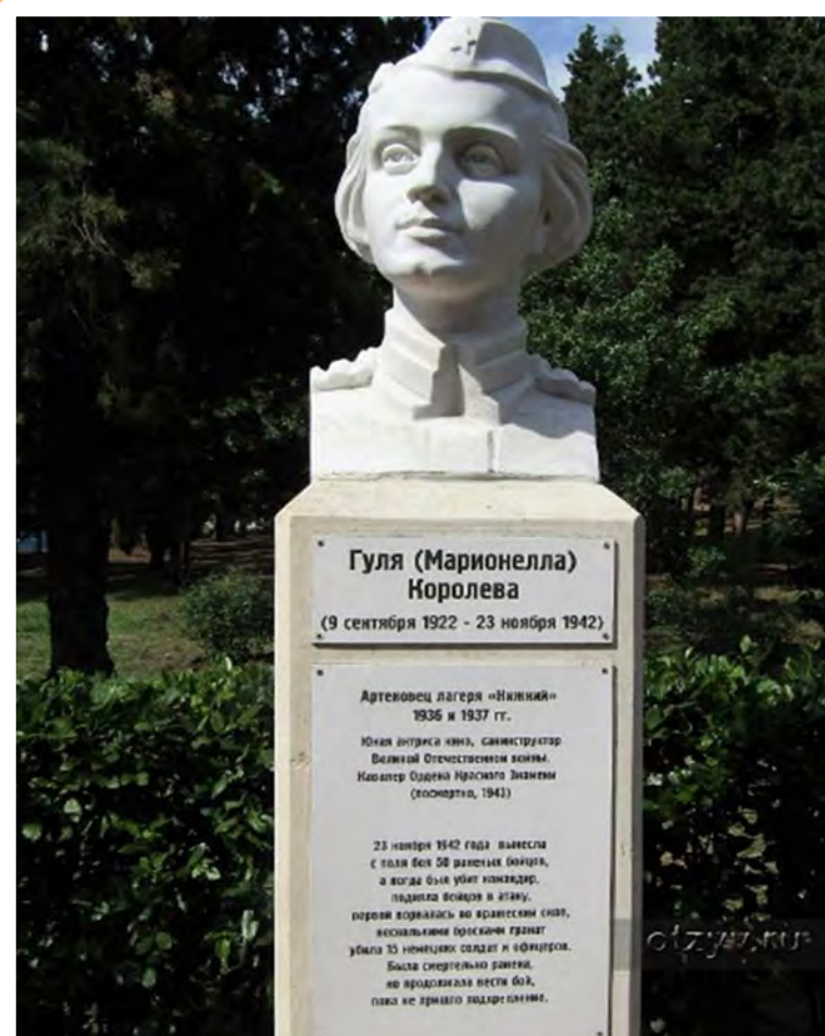
БЮСТ ГУЛИ КОРОЛЁВОЙ НА АЛЛЕЕ ГЕРОЕВ-АРТЕКОВЦЕВ