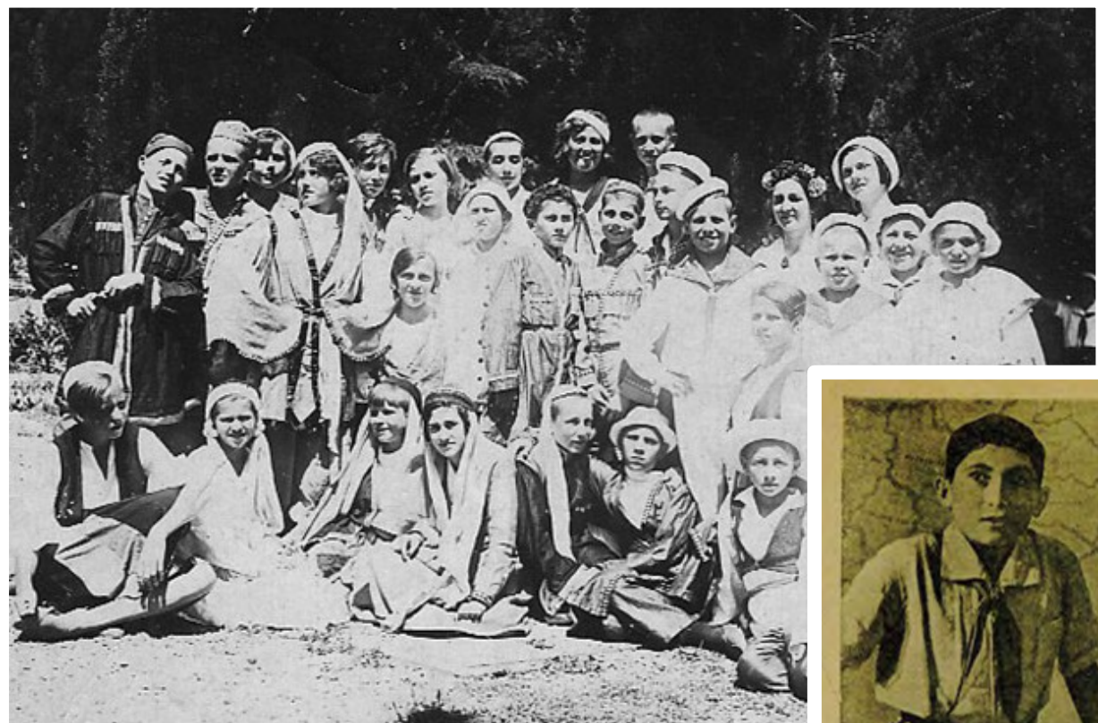
Лагерь «Нижний», 1936 год