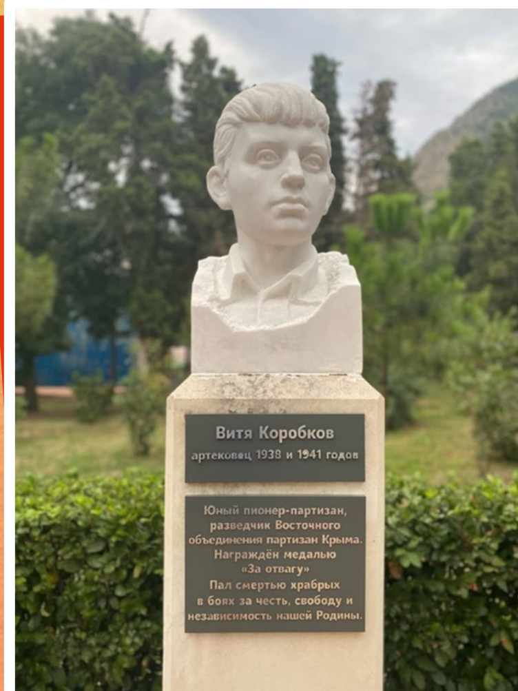
БЮСТ ВИТИ КОРОБКОВА НА АЛЛЕЕ ГЕРОЕВ-АРТЕКОВЦЕВ