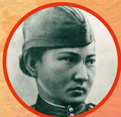
АЛИЯ МОЛДАГУЛОВА (1925-1944)

снайпер, ефрейтор, Герой Советского Союза