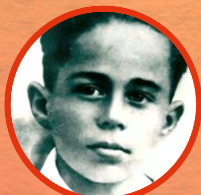
ВОЛОДЯ ДУБИНИН (1927-1942)

снайпер, ефрейтор, Герой Советского Союза