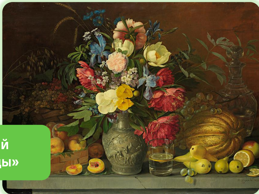
Иван Хруцкий «Цветы и плоды»