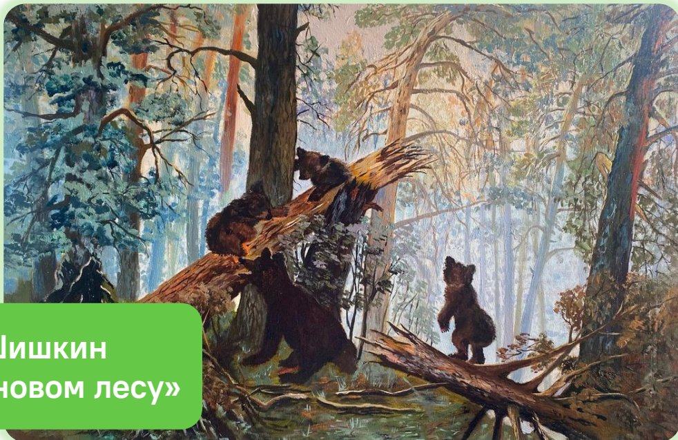
Иван Шишкин «Утро в сосновом лесу»