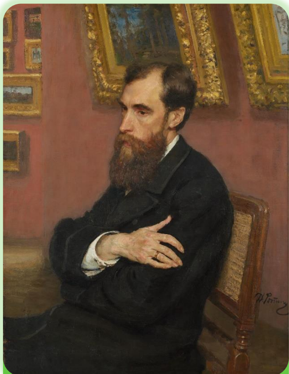
Портрет Павла Третьякова. Илья Репин, 1883