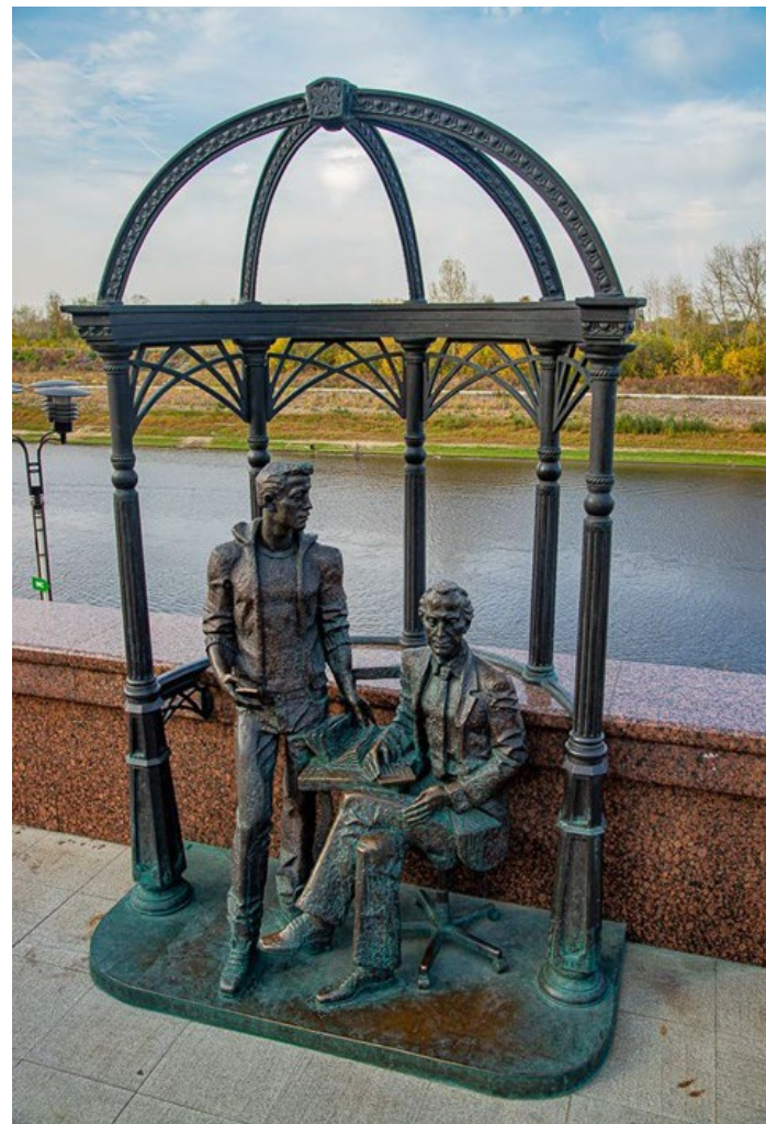
Студенты XX – XXI веков