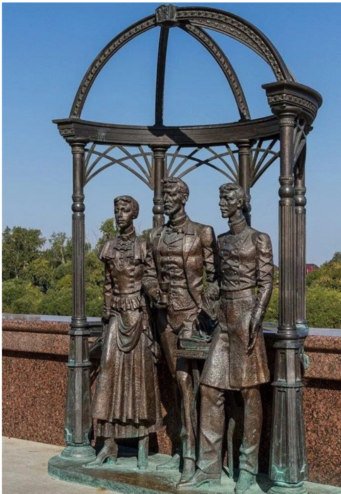
Студенты XIX века