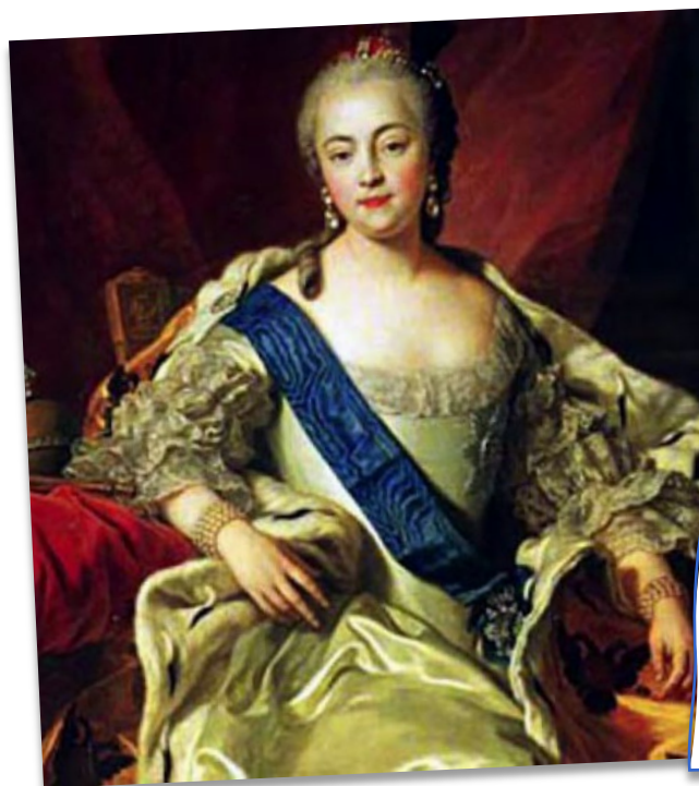
Шарль ван Лоо, «Портрет императрицы Елизаветы Петровны»

25 января 1755 года императрица Елизавета Петровна подписала указ об основании Московского университета