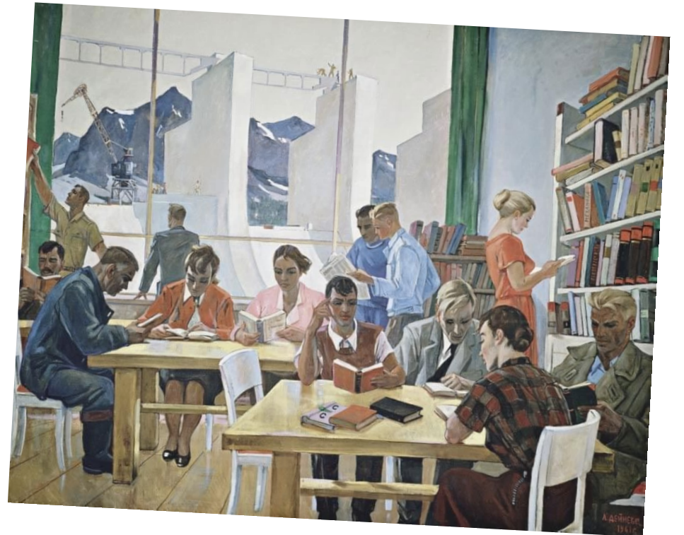
Дейнека А.А. «На учебе», 1961