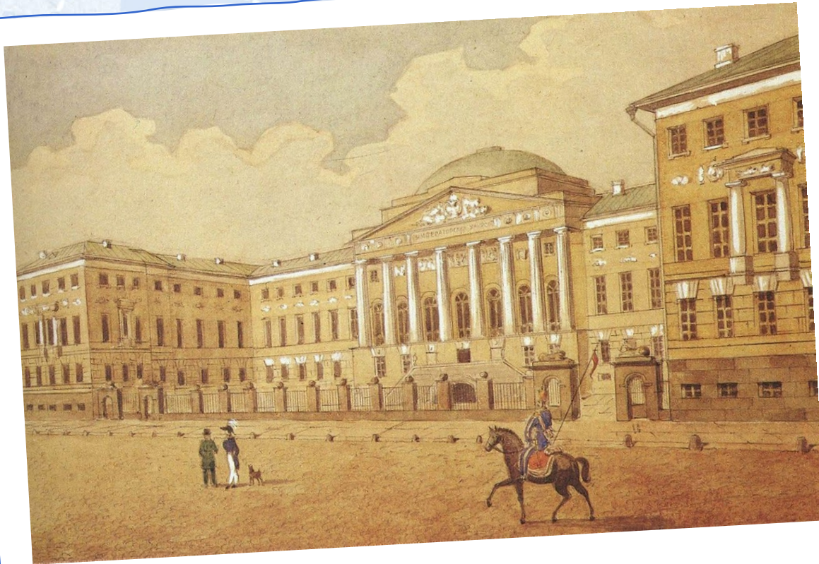
Московский университет в 1820 году