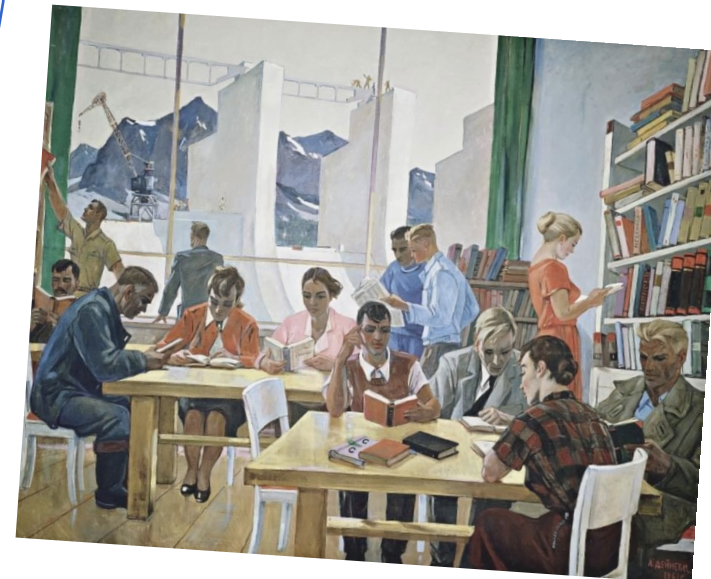
Дейнека А.А. «На учебе», 1961