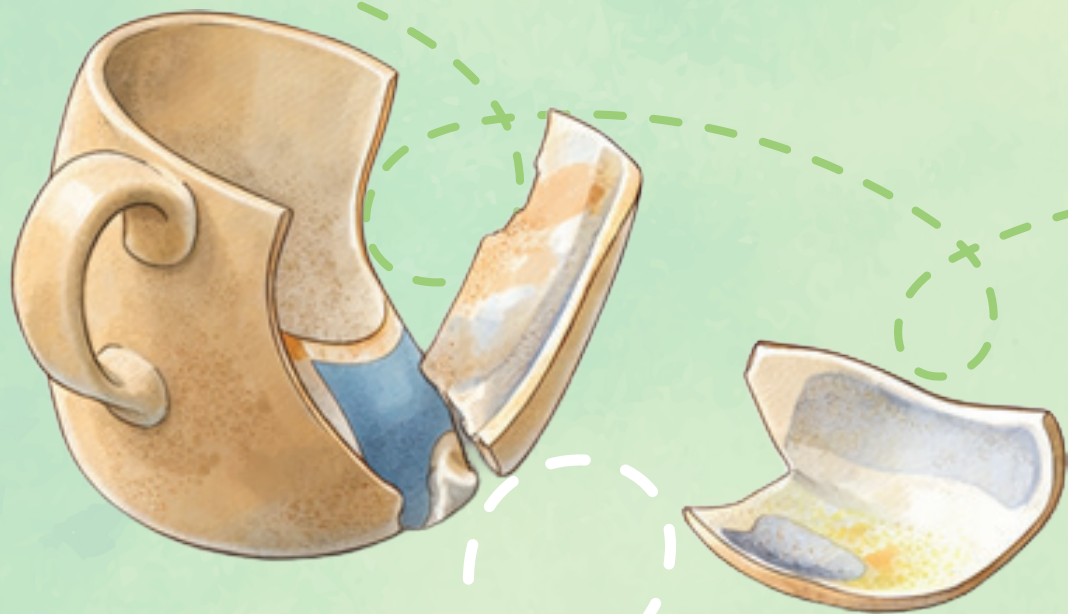
РАЗБИТАЯ ПОСУДА (КЕРАМИКА)