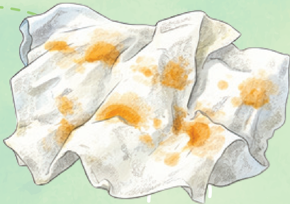
САЛФЕТКИ, ИСПАЧКАННЫЕ ЖИРОМ