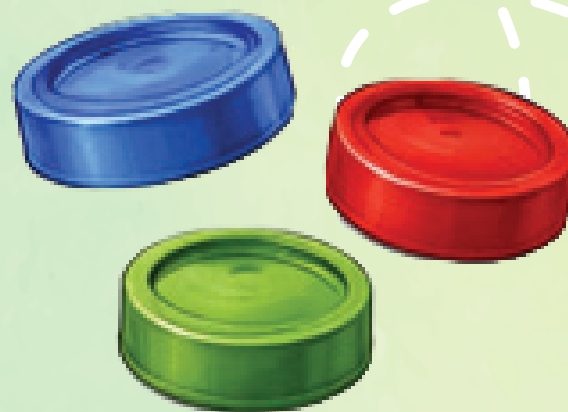
КРЫШКИ ОТ БУТЫЛОК