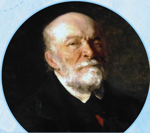
Николай Пирогов (1810–1881)