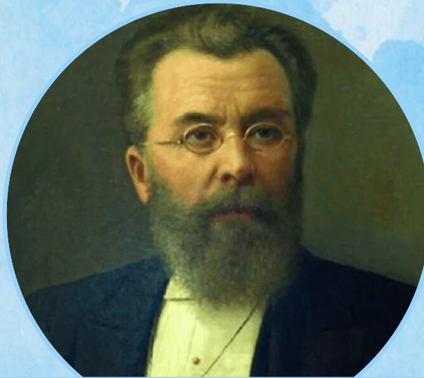
Николай Склифосовский (1836–1904)