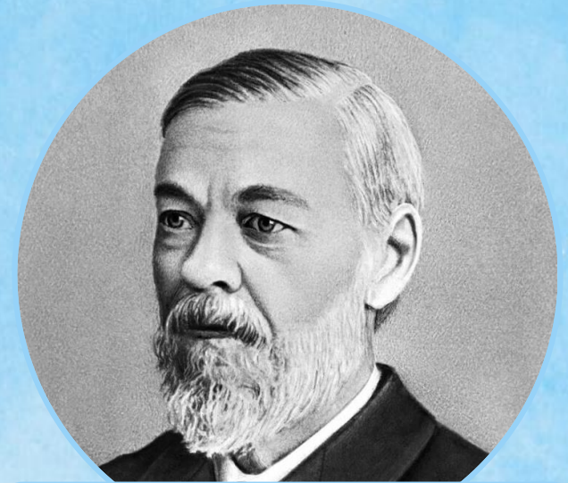
Иван Сеченов (1829–1905)