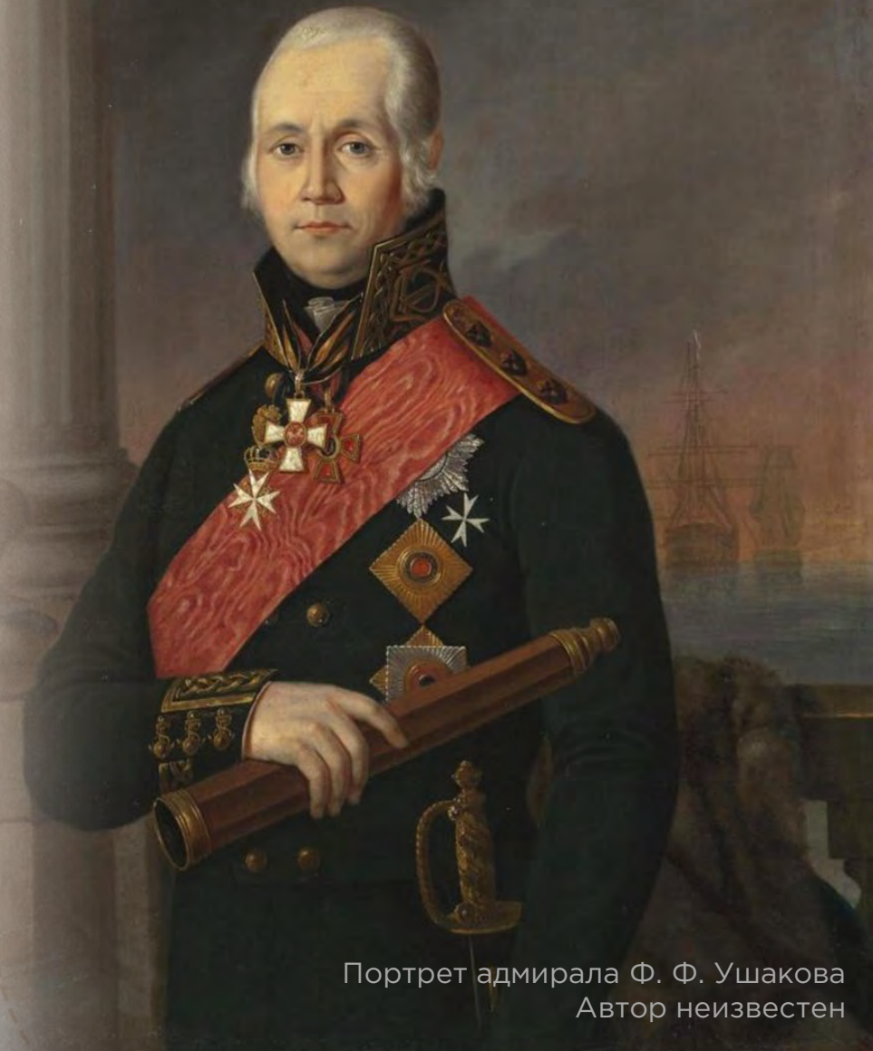
Портрет адмирала Ф. Ф. Ушакова Автор неизвестен