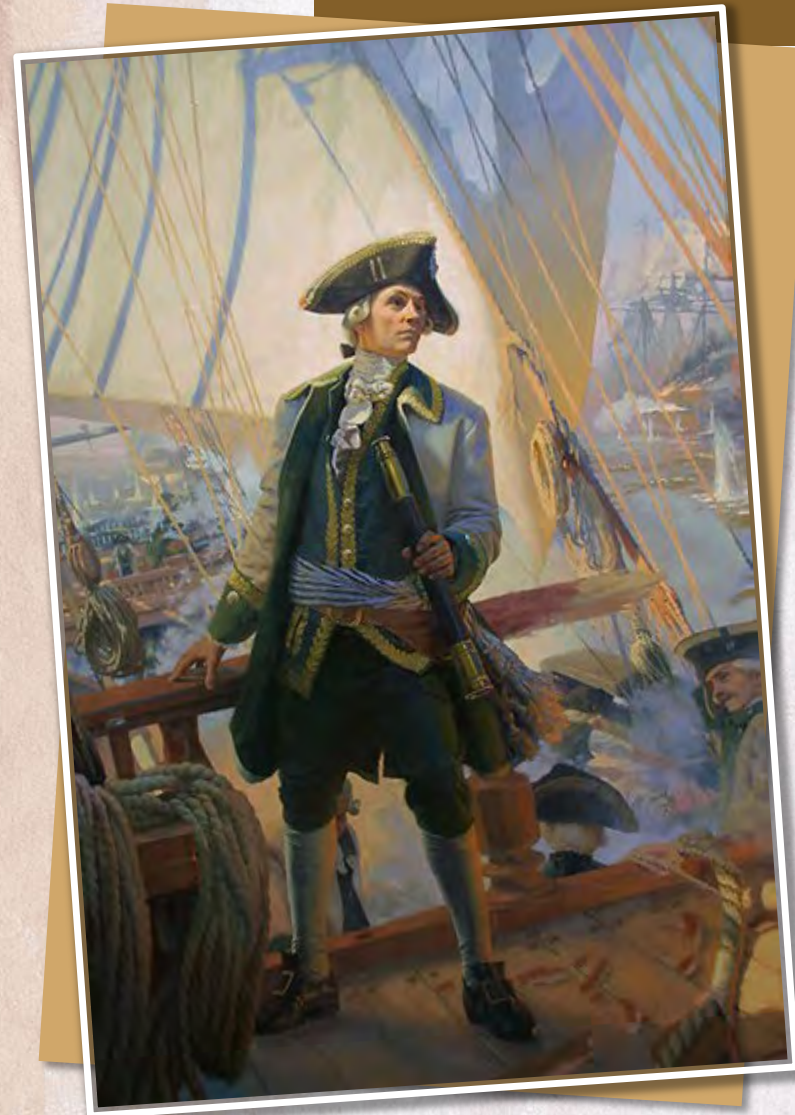
«Ушаков флотоводец», Н. Г. Николаев