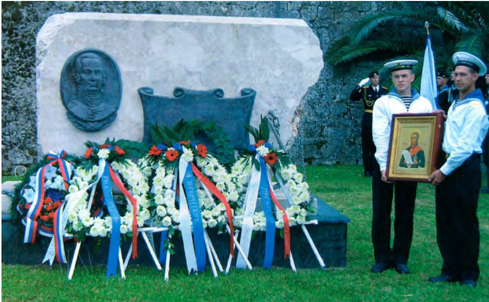
Памятник Ф. Ф. Ушакову на греческом острове Корфу

В 1797 году Франция захватила Ионические острова, и это создало угрозу черноморским владениям России. Эскадра, возглавляемая адмиралом Ушаковым, двинулась на освобождение островов.