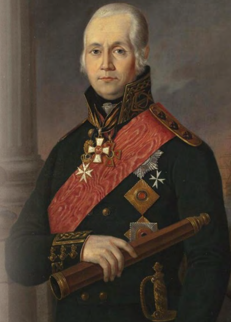
Портрет адмирала Ф. Ф. Ушакова Неизвестный художник, XIX в.