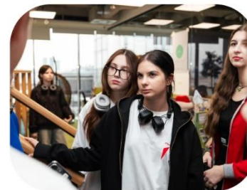
Фото и видео с ярмарки публикуются в сообществах первичных отделений, образовательных организаций, молодёжных и детских общественных объединений в социальной сети «ВКонтакте».